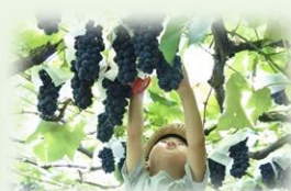
果物狩りや農業体験