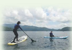
空や湖、山等を使ったスポーツ・体験