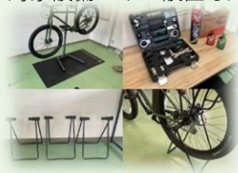
サイクルラックや工具の設置