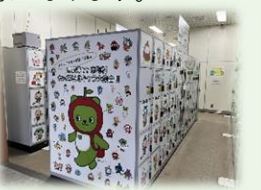
コインロッカーの設置