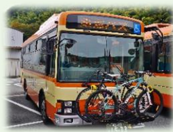
車外ラックを搭載したバス