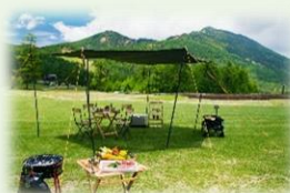
キャンプ・グランピング